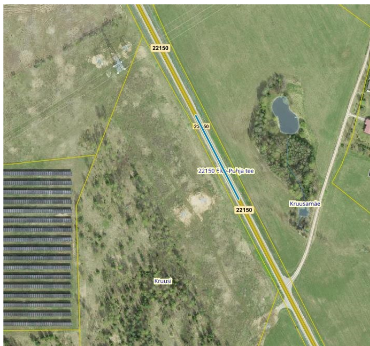
Joonis 1. Riigitee nr 22150 km 1,45-1,56, väljavõte Maa-ameti geoportaalist